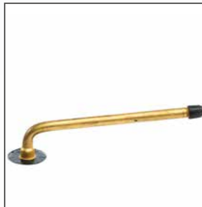
Ventil TR 78A