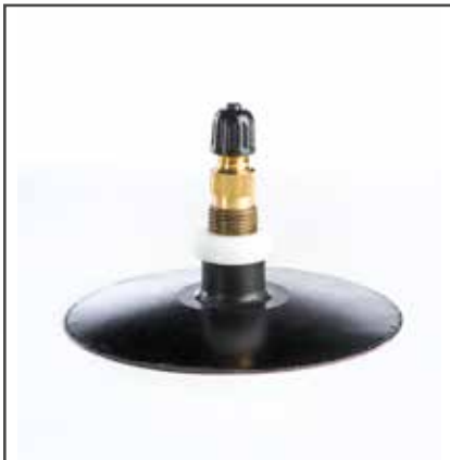
Ventil TR 218A