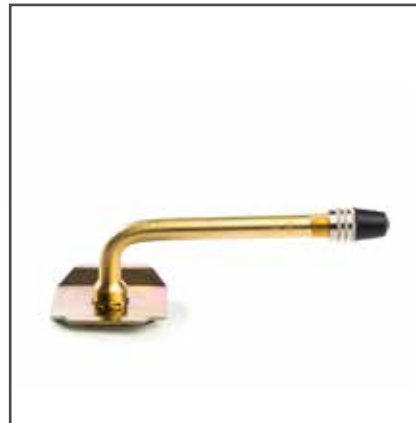
Ventil TRJ 1175