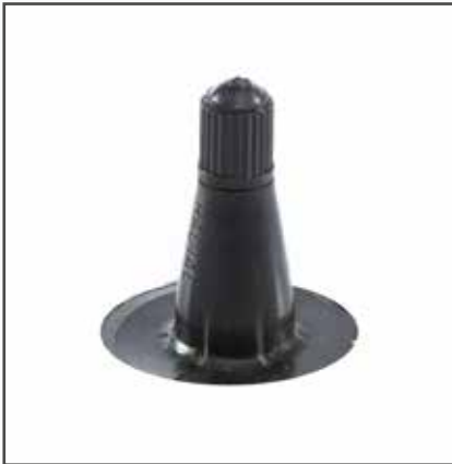
Ventil TR 15